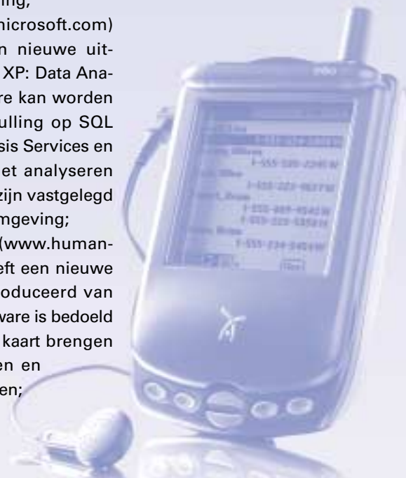
Handspring introduceerde tijdens de Comdex de zogenaamde Treo. Het gaat hier om een combinatie van GSM/Wap-telefoon, SMS (short message service) systeem en op PalmOS gebaseerde handheld computer.