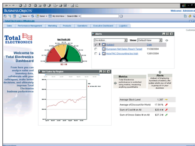
Afbeelding 2: Een standaard performance management dashboard, inclusief diverse soorten indicatoren en alarmsignalen. Dit beeld is representatief voor de management dashboards waarover XI-klanten kunnen beschikken.

Overigens is het niet de bedoeling dat de integratie beperkt blijft