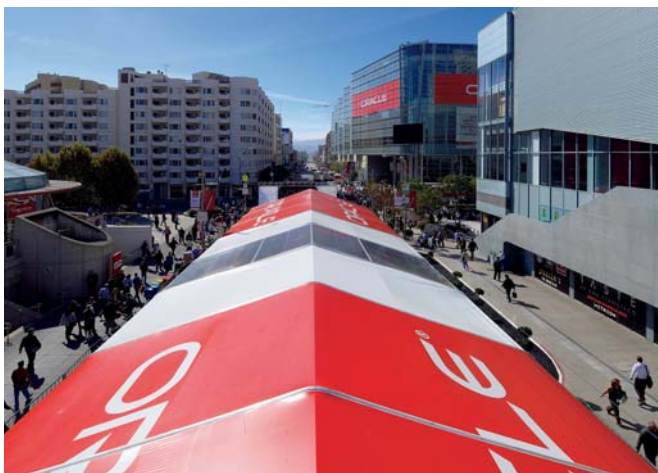
Oracle Open World begon in feite met het afsluiten van een straat

Oracle Open World begon in feite met het afsluiten van een straat. Howard Street, een belangrijke doorgaande weg, werd ter hoogte van het gigantische conferentiecentrum Moscone Center geheel in beslag genomen door grote tenten in Oracle-rood met daarop in witte letters het overbekende logo. De tenten dienden onder meer om de meer dan veertigduizend