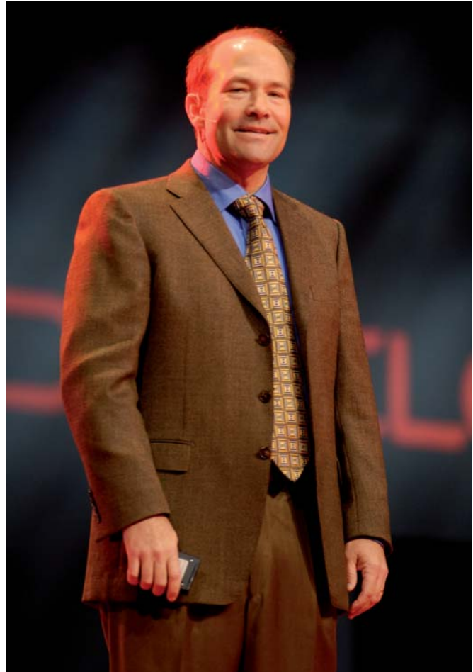
Wookey profiteerde al van Webcenter

wordt om informatie aan te passen aan de soort gebruiker, aan zijn rol, aan de applicatie die hij op dat moment gebruikt en zelfs aan individuele manier van werken en andere voorkeuren. De gebruikers is tot nu toe – alle methodologische discussies ten spijt - bij het ontsluiten van gegevens veel te weinig en veel te laat in het proces betrokken, en WebCenter en aanverwante nieuwe technologieën maken het mogelijk dit te veranderen. Kurian gaf ook aan dat de gebruiker dankzij het bezoek aan sites die ook van web 2.0 technologieën gebruik maken steeds hogere verwachtingen krijgt. De gebruiker die een character based terminalachtige applicatie zonder mokken accepteert, is langzamerhand uitgestorven. Datzelfde dreigt nu echter ook te gebeuren met applicaties die de user interface standaarden van tien jaar geleden hanteren, dus in die zin is het goed dat Oracle de bakens verzet. De concurrentie in de vorm van Microsoft en de nieuwe grafische mogelijkheden binnen Windows Vista slaapt tenslotte ook niet.