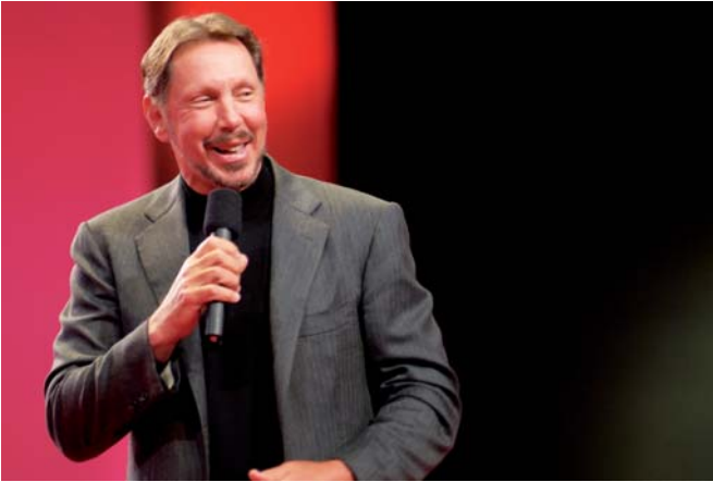
Larry kon weer lachen

Oracle zou vanaf nu ook een eigen versie van Red Hat Linux ter beschikking stellen, maar dan met patches die bovendien (en dat is inderdaad een verschil) ook voor eerdere versies zouden gelden, voortdurend updates van Red Hat-versies zou daarmee dus onnodig worden. Alle verwijzingen naar Red Hat zouden eruit gesloopt worden. Hm, dus dat betekende in feite een eigen Linux-distributie, dat kwam al meer in de buurt van echt nieuws. Leuk voor Red Hat ook, het bedrijf verdiende zijn geld niet met het verkopen van software, zoals Oracle, maar met het verkopen van support. Oracle zou dat nu voor de helft aanbieden en naar eigen zeggen ook veel beter. De zaal reageerde er positief op en langzamerhand werd Larry weer zichzelf. Hij begon zelfs een paar keer te lachen.